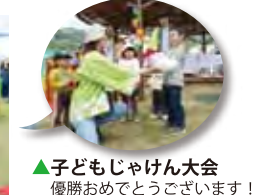
▲子どもじゃんけん大会