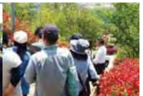
▲健康とふれあいの森ウォーキング

わんぱく広場からの眺望にマッチする「青い山脈」、NHK連続ドラマの主題歌など晴れやかな演奏を披露してくれました。