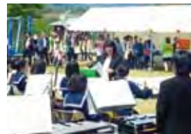
▲三野中学校吹奏楽部によるオープニング演奏

わんぱく広場からの眺望にマッチする「青い山脈」、NHK連続ドラマの主題歌など晴れやかな演奏を披露してくれました。