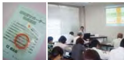
▲当財団スタッフもセミナーを受講し「認知症サポーター」の一員になりました。終了後にはオレンジリングが配られました。

「認知症」は誰もがなりうる身近な病気です。認知症に関する正しい知識を身につけ、地域全体で認知症の方とその家族のみなさんを支えていきませんか。無料の出張セミナーを受講できるので、ぜひお問い合わせを！