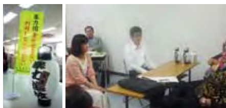
▲当財団スタッフが受けた講習の様子。迫力満点！いざという時に役立つ実践的な内容でした。

もしも、暴力団から不当な要求を受けた時どのように対応すべきか考えてみませんか？「不当要求防止責任者講習」は無料で講習が受けられるので、社内研修にオススメです！詳しくはHPを確認してお申し込みを。