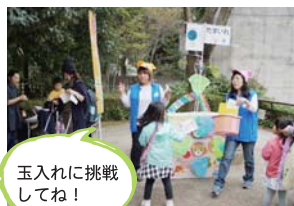
玉入れに挑戦してね!