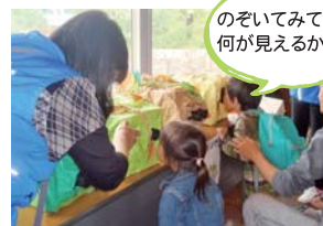
のぞいてみて。 何が見えるかな?