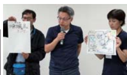
▲発表する参加者たち。