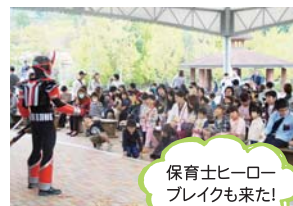
保育士ヒーロー ブレイクも来た!