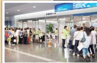
◀▼多くの方でにぎわう会場の様子