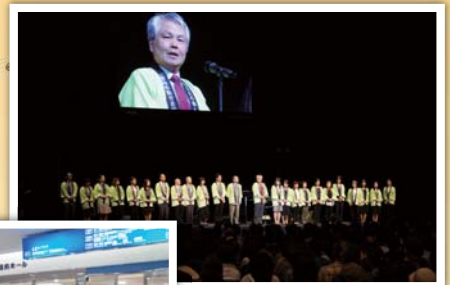
▲財団スタッフ挨拶

皆様からいただいた代金(入場整理券代)は全て、「ハートフルゆめ基金とくしま育成基金(▶P2)」へ寄付させていただきます。県内外の遠方からも多くの方がご来場下さり、感謝の念に堪えません。足をお運び下さいまして、誠にありがとうございました。