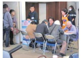
▲入口で記名に並ぶ来場者。

NPO法人フードバンクとくしまが毎年行っている越年支援に、財団スタッフも参加しました。みなさまから寄付いただいた食料品・生活用品を「ヒューマンわーくびあ（労働福祉会館 別館）」5F大ホールに揃え、10時～15時の開催時間に154名が受け取りに訪れました。物資だけでなく、生活困窮者には生活相談を受けるよう勧め、社会福祉協議会が相談室を設けました。昨年より来場者が増え、困窮者の増加を実感します。少しでも安堵できる年越しを支援できれば幸いです。