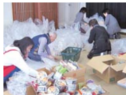
▲前日の食料品仕分けの様子。