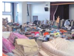
▲集まった衣類や生活用品。