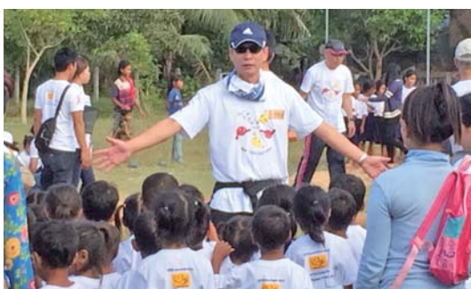
チェイ小学校運動会