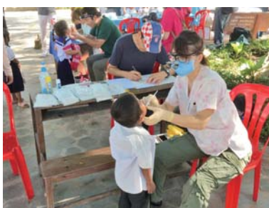
ツアー参加の歯科医師による検診

この貴重な経験を財団職員と共有し、今後の財団活動や社会貢献活動に活かして参ります。