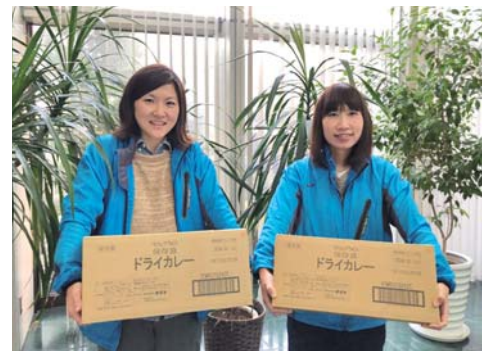
株式会社ネオピエント様より ドライカレー 349食を預かりました。

呼びかけに快く応じて下さった事業所・団体の皆さまのあたたかいお気持ちに、心より感謝申し上げます。