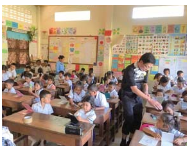
子ども達との交流