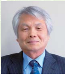
公益財団法人 徳島県勤労者福祉ネットワーク