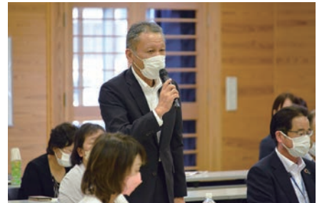
新評議員・理事による自己紹介