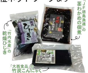
「大西食品」の竹炭こんにゃく

乾燥ひじきと茎わかめの佃煮は、阿南市椿泊産の天然物です。養殖とは一味違う風味をぜひご堪能ください。また、真っ黒な見た目がインパクト大な竹炭こんにゃくは、阿南市特産の「竹炭」から作られた「竹炭パウダー」を練りこんでいます。見た目と味のギャップをぜひお楽しみください。