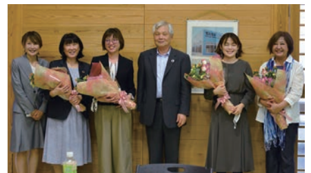
職員永年勤続表彰

第10回評議員会議事は下記の通りです。それぞれを提案し、満場一致で可決承認されました。