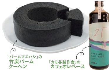
「バームマエハシ」の竹炭バームクーヘン 「カモ谷製作舎」のカフェオレベース

「竹炭パウダー」を練りこんだ真っ黒なバームクーヘンと、お遍路さんがデザインされたかわいいパッケージのカフェオレベースをセットにしました。カフェオレベースは、牛乳や豆乳で割って好みの濃さでお楽しみいただけます。