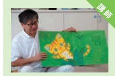
鳴門教育大学 大学院 国語科教育学