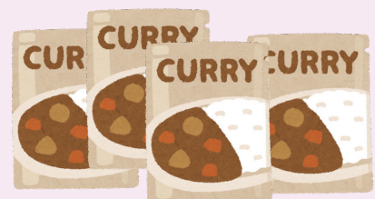
徳島県企業の食品