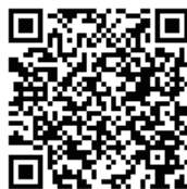
Google MAP ↑