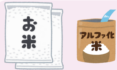
「徳島県産のお米」または「アルファ米」

お分けする食料品はほとんどが 徳島県産！地産地消、地場産業の発展にも 「つながり」ます！