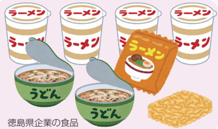
徳島県企業の食品