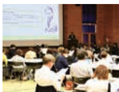
▲4/22 スタッフ全員会議で共有